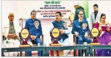
कश्मीरी युवा विनिमय कार्यक्रम में मौजूद कुलपति व अन्य शिक्षक.

कहा कि कश्मीर अब तेजी से देश की मुख्यधारा में शामिल हो रहा है. इसका विकास पूरे देश के विकास के लिए आवश्यक है. कश्मीर का विकास भारत के विकास के लिए बहुत महत्वपूर्ण है. कश्मीर की खुशहाली ही पूरे देश की