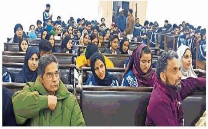
युवा विनिमय कार्यक्रम के दौरान कुलपति के संबोधन को सुनते कश्मीरी युवा